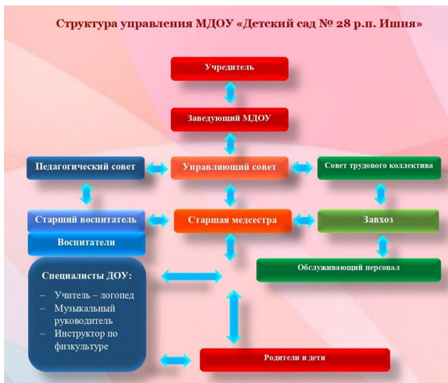
Органы управления, действующие в Учреждении

Управление МДОУ строится на принципах единоначалия и коллегиальности. Коллегиальными органами управления являются: управляющий совет, педагогический совет, совет трудового коллектива