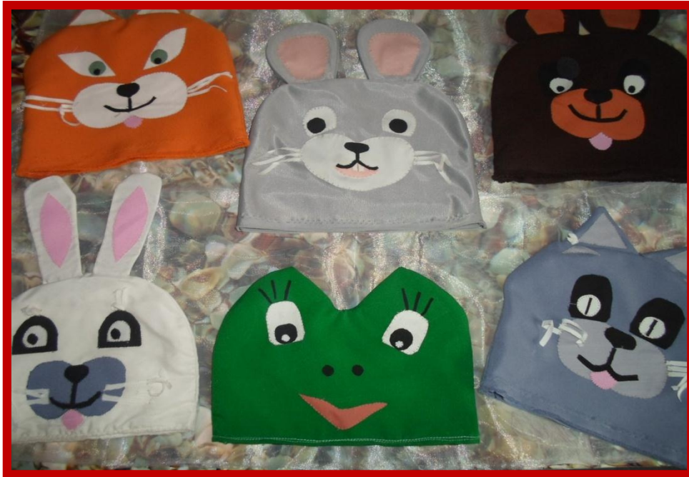
6)Использование готовых шапочек в работе с детьми.