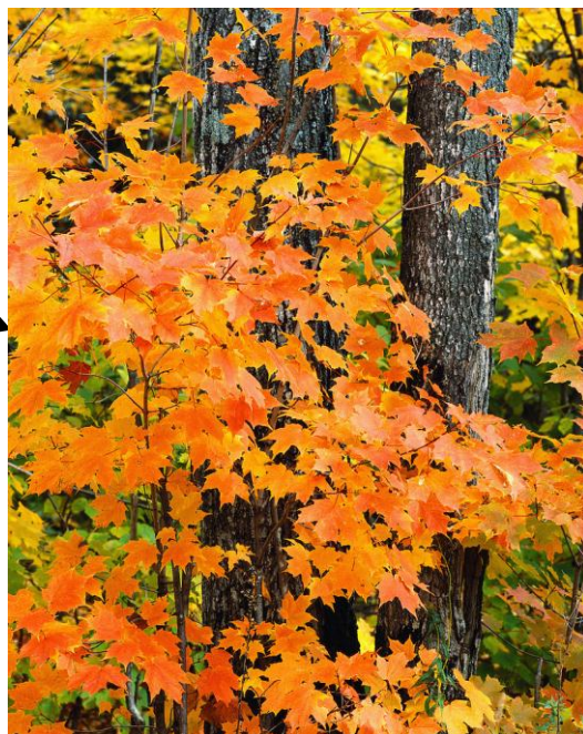
ОСЕННЯЯ КАРТИНКА (М. В. Сидорова)

Посмотри, как на картинке, гроздь алые горят. Это тонкие рябинки примеряют свой наряд. Рассыпает солнце искры, закружился листопад. И на ветках золотистых капли дождика дрожат. Ветер стих. Остановились в синем небе облака. Воробьишки в стайки сбились. И журчит, журчит река. Все тропинки и дорожки будто в пёстрых лоскутках. Это осень осторожно ходит с краскою в руках.